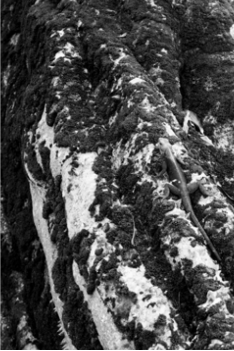
Miatta Kawinzi, Escuchar (lagarto) , 2026. Impresión fotográfica sobre tela.

a la pérdida, a la celebración y a la conexión, todo al mismo tiempo.