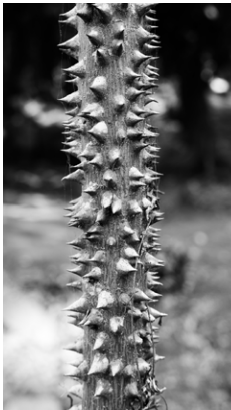
Miatta Kawinzi, Escuchar (crecimiento) , 2026. Impresión fotográfica sobre tela.

MK: Recientemente he estado reflexionando sobre la noción de lo iterativo en relación con mi práctica. Hay ciertas preguntas que exploro en mi trabajo a lo largo de largos períodos de tiempo, como: ¿de qué manera puede el lenguaje de la suavidad utilizarse para responder a la dureza social? Esto considera la suavidad como material (por ejemplo, en mi uso del estambre en escultura e instalación), la suavidad como sonido (como en la manera en que abordo el canto en tonos