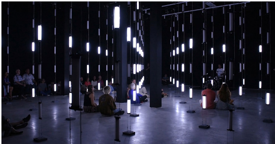
Ezra Masch, VOLÚMENES . Cortesía del artista.

los espacios abiertos entre las vigas para ubicar el centro de cada luz. Las superficies pintadas de blanco de las columnas reflejarán la luz y el color, por lo que me entusiasma crear interacciones que hagan un uso intencional de estos elementos arquitectónicos.